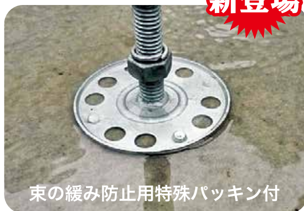
束の緩み防止用特殊パッキン付